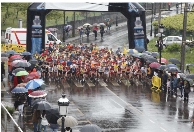
Saída da VII Carreira Pedestre