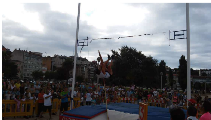
Xornada de “Saltando na praia” no areal de Sada

“Para esta tempada que estamos a comezar, dende o sector trataremos de continuar o plan do ano pasado. Queremos chegar a máis xente a través das concentracións. Promocionar o sector a través da consolidación do