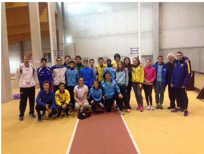
Concentración desenvolva polo sector de saltos este ano

Moitas grazas e que todos teñamos unha boa tempada 16/17”