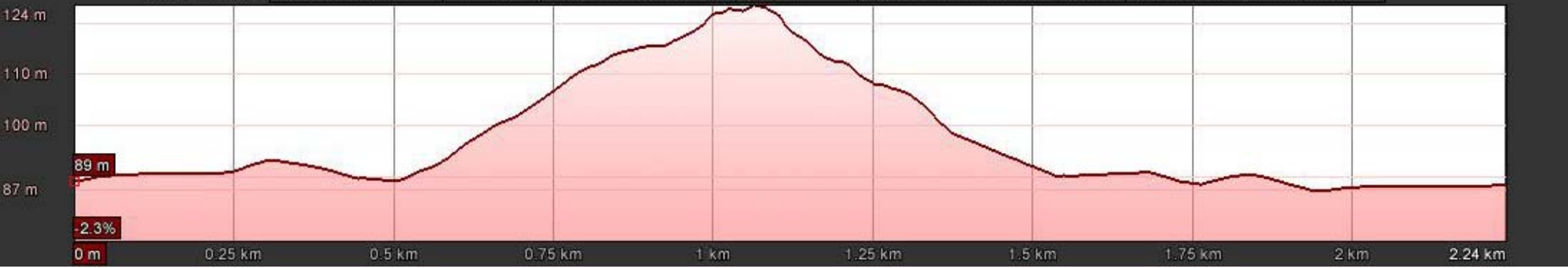
Gráfico: min., media, máx. Elevación: 87, 98, 124 m Total de intervalo: Distancia: 2.24 km Incremento/pérdida de elevación: 43 m, -43.8 m Pendiente máxima: 16.5%, -18.9% Pendiente media: 3.2%, -4.6%

Fecha de las imágenes: 4/13/2010 2001 42°17'32.73" N 8°05'35.68" O elev. 146 m Alt. ojo 1.83 km