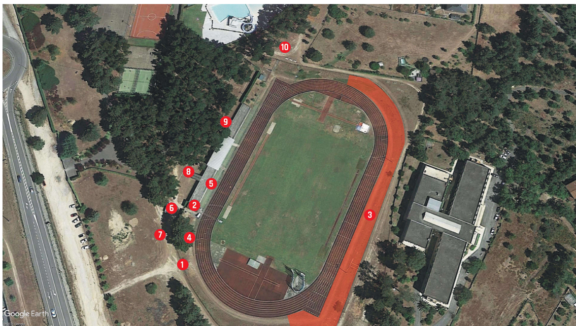
PISTA DE ATLETISMO JOSEFINA SALGADO - COMPLEXO DEPORTIVO DE MONTERREI

1. Acceso Atletas-Adestradores/as-Delegados/as 2. Secretaria 3. Zona de Quecemento 4. Cámara de Chamadas 5. Aseos 6. Saida Pista 7. Ambulancia 8-9. Acceso-Saida grada 10. Vestuarios-Aseos Grada