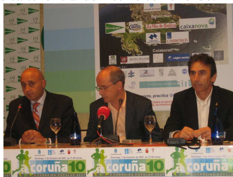
(modelo de roda de prensa que deberá convocar o organizador)

Art. 15.- O organizador convocará unha roda de prensa convidando aos medios de comunicación locais, para isto poderá contar ca axuda do responsable de comunicación da FGA. A mesma estará presidida polo representante da organización e deberá convidarse ao delegado da FGA no ámbito territorial do evento e as personalidades representantes das institucións ou organismos que patrocinen o campionato (concello, deputación, etc.). Serán susceptible de invitación aquelas empresas que colaboren materialmente co mesmo. Esta roda de prensa farase a lo menos con 3 días de antelación ao comezo do evento e contará co cartel oficial do mesmo como fondo.