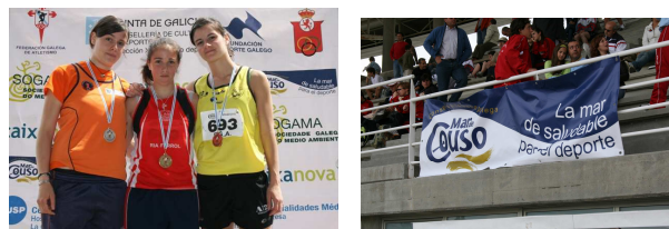
(modelo de pancartas que proporcionará a FGA)

Art. 14.- O cartel oficial do evento deberá seguir a seguinte liña de deseño: Nome do Campionato, lugar, data e hora de inicio da competición. Tamén se incluírán o logotipo da FGA, da Secretaría Xeral para o Deporte e do Deporte Galego, xunto cos logotipos dos patrocinadores, todos estes nun lugar que permita a máxima visibilidade. A maiores poderanse incluír logotipos de empresas colaboradoras locais, sempre nun tamaño menor do resto dos logotipos anteriormente citados. O