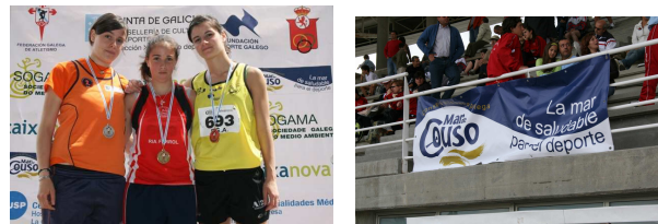
(modelo de pancartas que proporcionará a FGA)

Art. 14.- O cartel oficial do evento deberá seguir a seguinte liña de deseño: Nome do Campionato, lugar, data e hora de inicio da competición. Tamén se incluírán o logotipo da FGA, da Dirección Xeral para o Deporte e do Deporte Galego, xunto cos logotipos dos patrocinadores, todos estes nun lugar que permita a máxima visibilidade. A maiores poderanse incluír logotipos de empresas colaboradoras locais, sempre nun tamaño menor do resto dos logotipos anteriormente citados. O deseño deste cartel deberá presentarse á FGA antes da súa publicación polo menos con 30 días de antelación, para a súa aprobación definitiva.