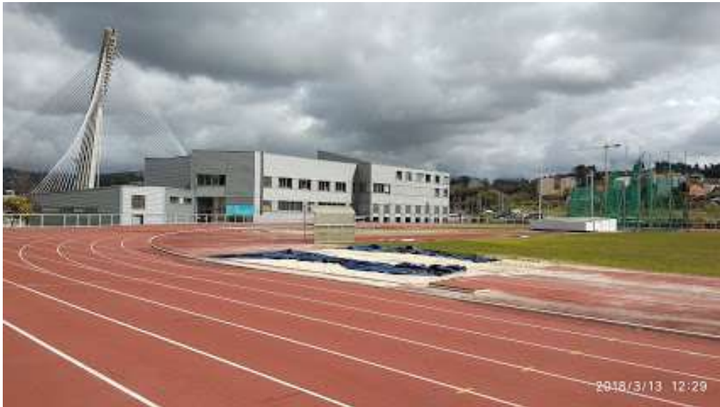
Pistas de Atletismo do CGTD Rúa Padre Olmedo, 1 36.002 Pontevedra